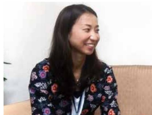
The Japan Foundation Ai Goto